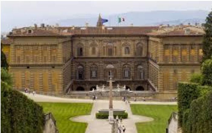
Firenze, Palazzo Pitti e il giardino di Boboli.

Seconda Domanda: Perché avete scelto questo lavoro? Vi piace il vostro lavoro?