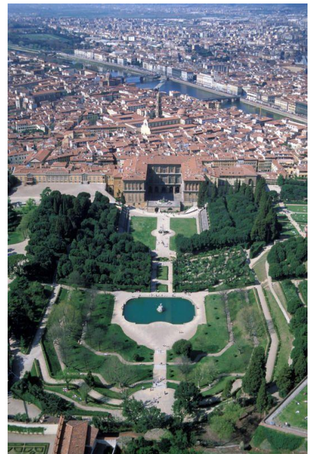
Firenze, il giardino di Boboli.