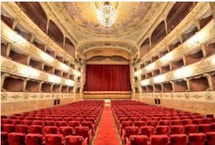
Firenze, il Teatro della Pergola.