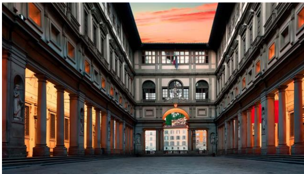
Firenze, la Galleria degli Uffizi.