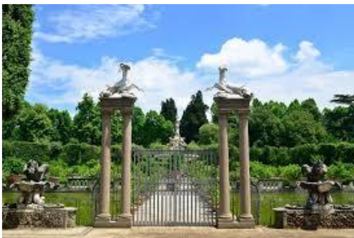
Firenze, il giardino di Boboli.

con noi e si trovano poi a dover svolgere delle attività all'interno dei musei, come delle piccole guide, sono investiti anche del ruolo di essere un po' responsabili del luogo in cui si trovano in quei giorni e di osservare anche i comportamenti delle persone e, se necessario, intervenire, in modo molto gentile, ad esempio ricordando a qualche sbadato che non si possono strappare i fiori al giardino di Boboli. Un episodio che ricordo ad esempio è quando al giardino di Boboli un ragazzo mi avvertì che c'era qualcuno in un luogo vietato. Finalmente sono riuscita a telefonare alla direttrice del giardino e tutta preoccupata le dissi che un ragazzo mi aveva segnalato una persona in una zona vietata. Indovinate chi era quella persona? Proprio la stessa direttrice, con un giardiniere. Ma mi disse che avevo fatto bene a segnalare e che aveva sbagliato lei a non avvertirci. Quindi sì, potremmo scrivere un libro sugli episodi che capitano nei musei. Ancora: molti si perdono e non ricordano più dove si trovano. Una volta una signora che usciva dalla galleria dell'Accademia ci chiese dove si trovasse e noi rispondemmo che si trovava in piazza San Marco e lei insisteva che non era possibile perché piazza San Marco è a Venezia... Quindi l'invito per tutti è di viaggiare sempre con gli occhi aperti, con tutti i 5 sensi attivi, facendo attenzione a tutto quello che ci circonda.