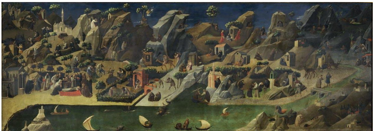
Tebaide, Beato Angelico, Firenze, gallerie degli Uffizi.