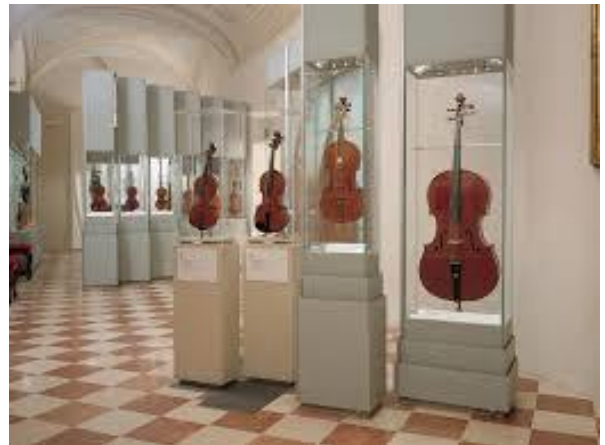
Gli strumenti musicali alla galleria dell'Accademia di Firenze.

Elisa: Diciamo che nei musei succede un po' di tutto . Negli anni in cui svolgevo servizio nella sala, alla galleria dell'Accademia, entravano circa 7000 persone al giorno. Ho avuto modo di incontrare e accompagnare persone famose di tutto il mondo: attori, cantanti, politici... ad esempio ho accompagnato l'attore che interpretava Ridge nella soap opera Beautiful con tutta la sua famiglia ( ricordo che lui era molto interessato agli strumenti musicali ). Poi ricordo una ragazza della famiglia Kennedy, molto interessata ai gioielli. Un giorno ho accompagnato un signore in bermuda e maglietta, era in vacanza. La sera stessa ho scoperto dai giornali che era una personalità importantissima. Ricordo un Principe indiano bellissimo che mi regalò una confezione di the verde che non osavo aprire. Però ho anche assistito anche a