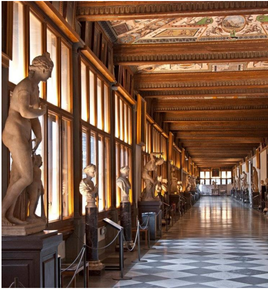
Firenze, galleria degli Uffizi.

al pubblico , ed entrate in questi corridoi, pieni di statue, pieni di quadri, di colori... e le vostre espressioni indicano questa saggezza profonda dell'intuire la bellezza, di saper godere di questa bellezza, magari in una forma semplice ma dove c'è tutta la potenza dell'apprezzare il bello. Questa è la cosa più bella che ho nella memoria e che mi ha aiutata a capire perché voglio stare in mezzo ai bambini e ai giovani. Perché in qualche modo mi insegnano la spontaneità, a staccarmi un po' qualche volta dalle citazioni, dalle note a piè di pagina dei libri.